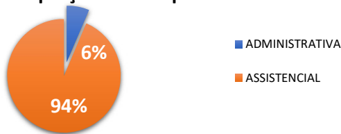
Proporção das Despesas